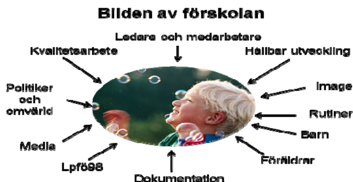
Bild 1 Bilden av och förväntningar på förskolan

Förväntningarna på förskolan är stora och de kommer från skilda håll. Sedan slutet på 1990-talet har kvalitén i förskolans och skolans verksamhet ifrågasatts från många håll och på många områden.