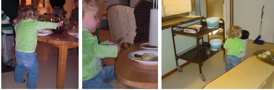
Exempel på det kompetenta barnet.

Flickan ovan är ca 1 år och 4 månader och tar själv mat, sätter sig och äter samt dukar av efter måltiden.